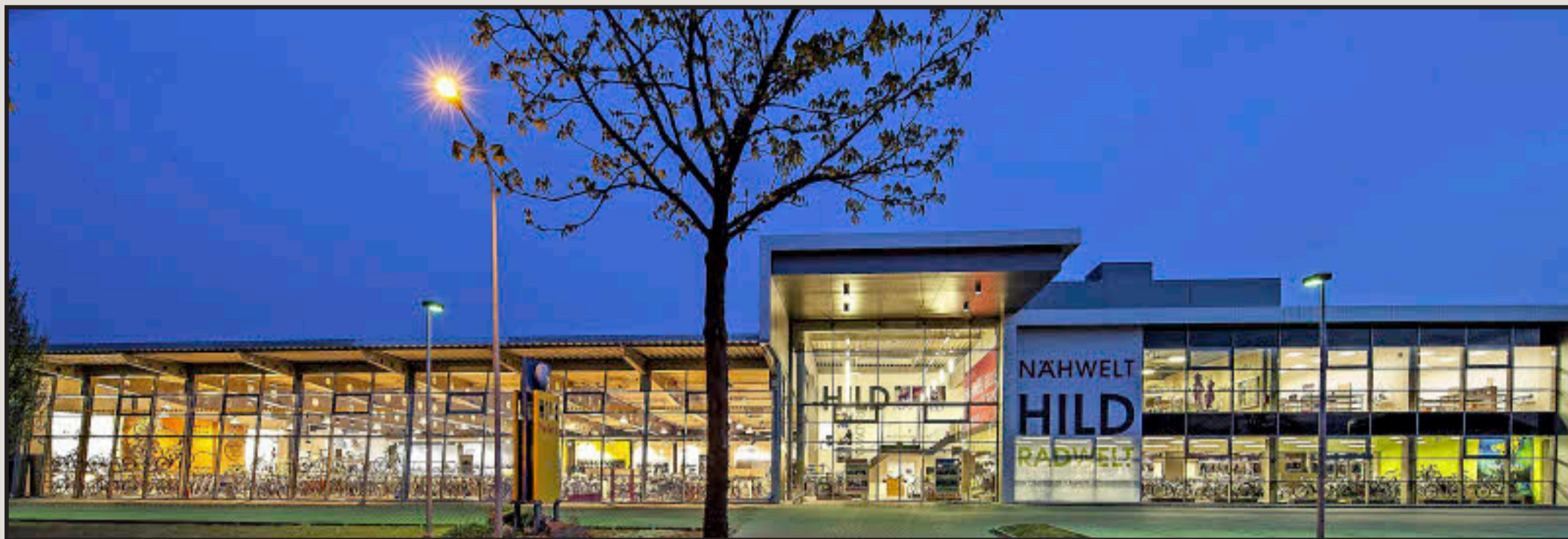
Unten Radwelt, oben Nähwelt: Hild bietet unter einem Dach eine riesige Auswahl an Rädern, E-Bikes und Zubehör sowie Nähmaschinen, Accessoires und Kurse für alle, die kreativ sind oder werden wollen.