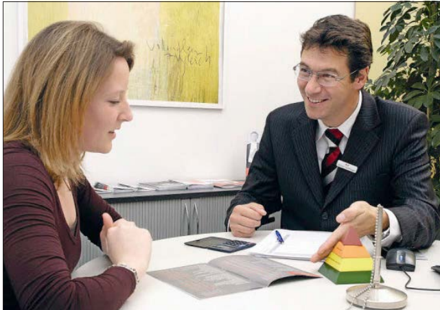
96 Prozent zufriedene Kunden und äußerst positive Imagewerte kann die Sparkasse Freiburg-Nördlicher Breisgau für sich in Anspruch nehmen.