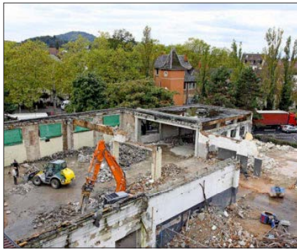
Die ehemalige Abfällhalle weicht und macht Platz für einen grandiosen Tanzpalast: Bis Ende 2015 plant die Tanzschule Gutmann an Leo-Wohleb-Straße lichtdurchflutete Räume und eine gemütliche Lounge.

Zum Auftakt des um eine Energieberatung erweiterten Angebotes im Beratungszentrum Bauen findet am Montag, den 20. Oktober, um 16 Uhr im großen Sitzungssaal des technischen Rathauses in der Fehrenbachallee eine öffentliche Veranstaltung statt. Das Beratungszentrum stellt seine Arbeit vor. In einem Festvortrag beleuchtet die Freiburger Architektin und Energieberaterin Diana Wiedemann Möglichkeiten der energetischen Sanierung von denkmalgeschützten Gebäuden.